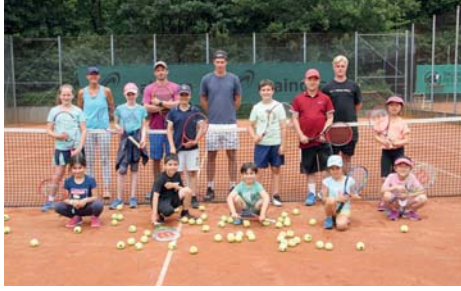
Auch dieses Jahr findet das Jugend-Trainingscamp des Sulzbacher Tennisvereins unter Corona-Bedingungen statt.

Sommertag: Jugend des TVST trainiert auch in den Ferien