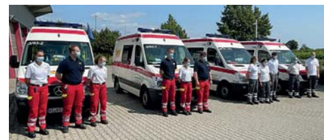
Am vergangenen Donnerstag machten sich vier Krankentransportwagen auf den Weg ins Katastrophengebiet.

Auch der Main-Taunus-Kreis zeige sein Mitgefühl und seine Solidarität mit den Opfern der Flutkatastrophe, so die Vertreter der Kommunen. Ehrenamtliche Helfer aus dem Landkreis hätten sich bereits auf den Weg gemacht, um beim Aufräumen zu helfen. Auch Kräfte des Katastrophenschutzes seien dort im Einsatz. Nachdem einige Feuerwehrleute bereits zurückgekehrt waren, seien auf Befehl des Landes Hessen am vergangenen Donnerstag vier Krankentransportwagen mit zwölf Helfern des Deutschen Roten Kreuzes und des Arbeiter-Samariter-Bundes nach Rheinland-Pfalz ausgerückt. Sie sollen für fünf Tage das hessische Kontingent im Hochwassergebiet verstärken. red