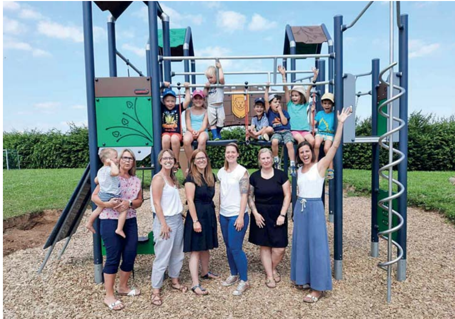
Voller Freude nahmen die Kinder der katholischen Kindertagesstätte das neue Klettergerüst im Außenbereich in Beschlag.

Letztlich geht es doch nur um die simple Abwägung, mit welchem Risiko eine Immunisierung gegen Sars-Cov-2 verbunden ist. Lasse ich mich impfen oder warte ich, bis ich mich von allein infiziere? Und da ist die Wahrscheinlichkeit, wegen einer Corona-Erkrankung im Krankenhaus zu landen auch für Jüngere nach wie vor hundert-, wenn nicht gar tausendfach höher als die Wahrscheinlichkeit von Nebenwirkungen der Impfung aufs Krankenbett geschickt zu werden.