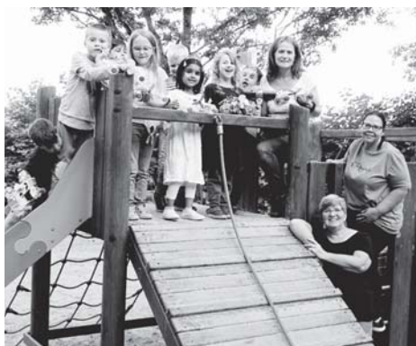
Die Kita „Pfiffikus“ verabschiedete neun Kinder, die demnächst in eine neue Lebensphase eintreten.

Das Erlebte sowie die dabei gesammelten Eindrücke sorgten dafür, dass die Kinder abends müde, aber bestens gelaunt mit ihren Eltern den Nachhauseweg antraten.