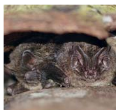
Auch die Mopsfledermaus kommt in Hessen vor.

Voraussetzung für die Teilnahme an dieser Reise ist der Nachweis einer vollständigen Impfung zum Schutz vor COVID-19 oder eine Genesenen-Bescheinigung. Außerdem ist eine Anzahlung in Höhe von 50 Euro pro Reisetilnehmer zu leisten. Alle weiteren Einzelheiten erfahren Sie bei der Anmeldung im Rathaus.