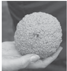
Die Früchte des Osagedorns werden heute von keinem Tier mehr gefressen.

Die Früchte des Osagedorns werden heute von keinem Tier mehr gefressen. Das Fruchtfleisch der chinesischen Blaugurke ähnelt dem einer Litschi.