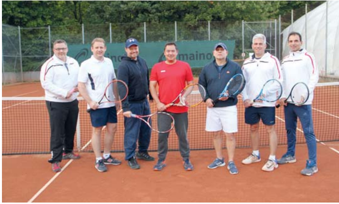
Die „Herren 40“-Mannschaft des TVST genoss entspannt den Aufstieg in die Bezirksliga.

Herren 65 I, Bezirksoberliga, unbesiegter Gruppensieger. Damit Aufstieg in die Gruppenliga. Herren 65 II, Bezirksliga A, 5. Platz. Gerhard Schöffel