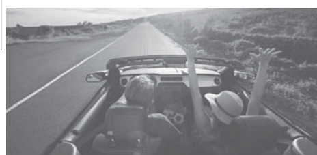
Moderne Hörgeräte sind winzig klein und geben neue Freiheiten statt altbacken zu wirken.