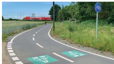
So ein Radschnellweg soll auch zwischen Bad Soden und Eschborn entstehen. Aktuell läuft eine Online-Umfrage, um die besten Trasse zu finden, die vielleicht durch Sulzbach verläuft.