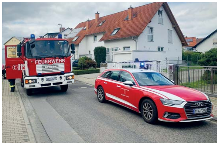
Feuer in der Garage. Am vergangenen Sonntag kam es im Keltenweg zu einem Brand in einer ein Wohngebäude angeschlossenen Garage. Beim Eintreffen der Feuerwehr hatte der Bewohner den Brand bereits gelöscht. Die Einsatzkräfte mussten nur noch Nachlöscharbeiten erledigen und die Garage belüften.