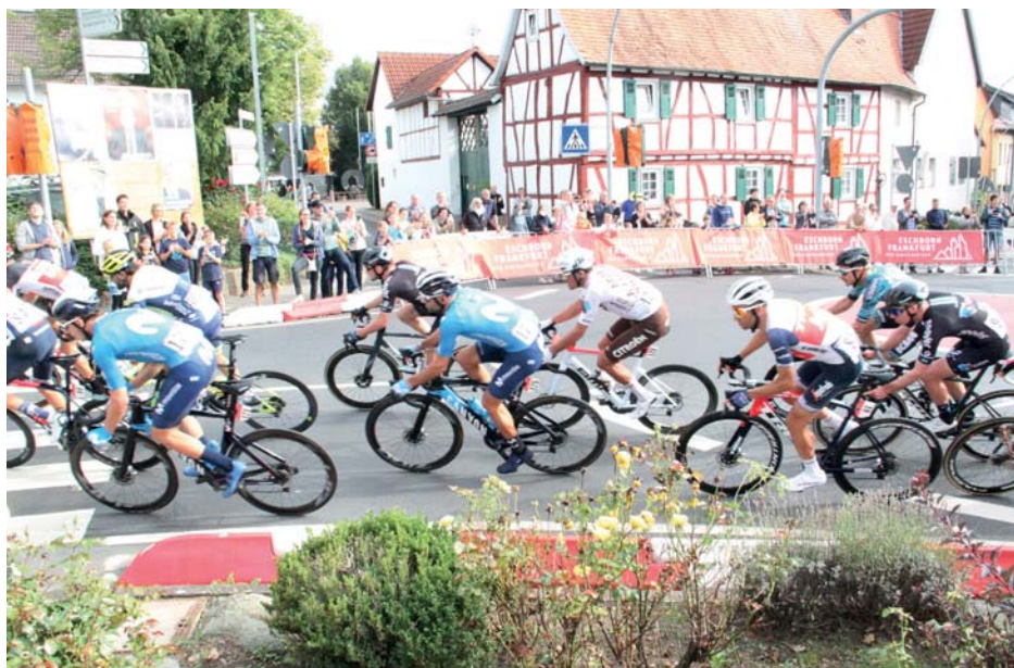
Zweimal schoss das Feld spektakulär um die Kurve am „Großen Dalles“, bevor es Sulzbach in Richtung Schwalbach verließ.