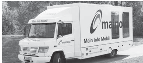
Rund um das Thema Energie können sich Mainova-Kunden und Interessenten am Montagmorgen informieren.