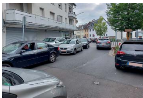
Im Bereich vor dem Sulzbacher Rathaus herrschte am Sonntag in der Hauptstraße immer wieder ein Verkehrs-Chaos, das Autofahrer und Anwohner gleichermaßen ärgerte.

Schwalbach stand der Verkehr still. Chaos herrschte ab etwa 12 Uhr in der Hauptstraße und den Zufahrtsstraßen. Wer von der Bahnstraße kam, fuhr bis zum Sperrgitter am „Großen Dalles“, wo es nicht mehr weiterging. Kein Wunder also, dass sich der Ärger bei den Autofahrern und den Anliegern wegen der vermehrten Abgase verbal entlud. Auch die Streckenhalter bekamen den Unmut ab, obwohl sie versuchten, die Staus zu entwirren. gs