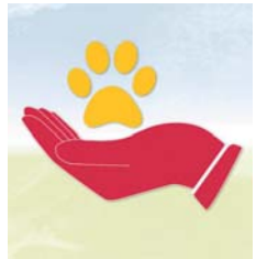
So sieht das Logo der Aktion „Trockene Pfoten“ der Tierschutzorganisation „TASSO“ aus.