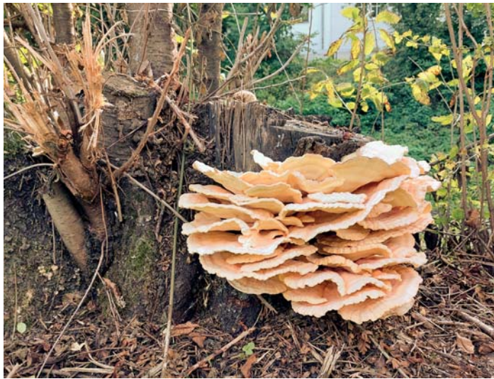
Der Gemeine Schwefelporling hat sich einen sonnigen Platz auf dem Kirschbaumstumpf gesucht.