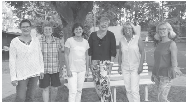
Die Damen 60 freuen sich, dass sie in die Verbandsliga aufsteigen dürfen.

Nach der 2:3-Niederlage unter der Woche beim Mitkonkurrenten BSC Schwalbach war es wichtig im Heimspiel gegen