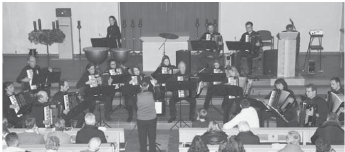
Mit zwei Konzerten will der Akkordeon-Club wieder neu starten. Der letzte Auftritt war das Advenzkonzert 2019. Im November wollen die Musiker im Bürgerzentrum aufzutreten.