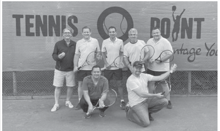
Auch die Herren 40 des TVST waren erfolgreich und steigen in die Bezirksliga B auf.