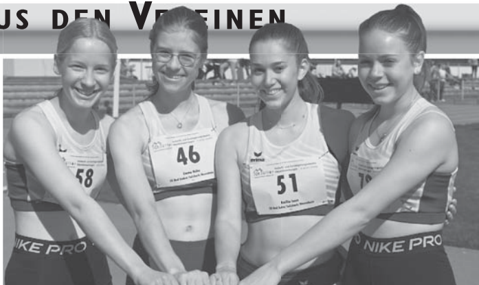
Die 4x100 Meter-Staffel der Altersklasse wU16 der LG Bad Soden/Sulzbach/Neuenhain hat sich inzwischen zu einem hessischen Spitzenquartett mit Top-Zeiten entwickelt.

Sportlich gesehen war es für die LG BSN eine recht erfreuliche Veranstaltung. Mit 18 Kreistiteln, 10 Silber- und 9 Bronzemedailien war die LG der erfolgreichste Kreisverein (ohne Seniorenwertung). DJK Hattersheim kam auf 15 Titel, die TG Schwalbach und die LG Eppstein-Kelkheim stan-