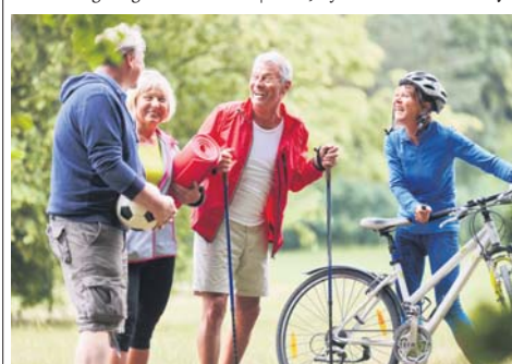
Walken und Radeln sind für Ältere empfehlenswert.

slung, gibt es noch andere Fitness-Optionen. Viele Tipps und News hierzu finden Interessierte unter www.ch-alpha.de . So kann Wassergymnastik gerade bei Arthrose unerwünschtes Übergewicht abbauen. Zur Stärkung der stützenden Muskulatur ist auch Krafttraining eine gute Alternative. Für mehr Geschmeidigkeit und Mobilität sorgen außerdem Tai-Chi, Hatha-Yoga, Tanzen oder (Hocker-)Gymnastik.