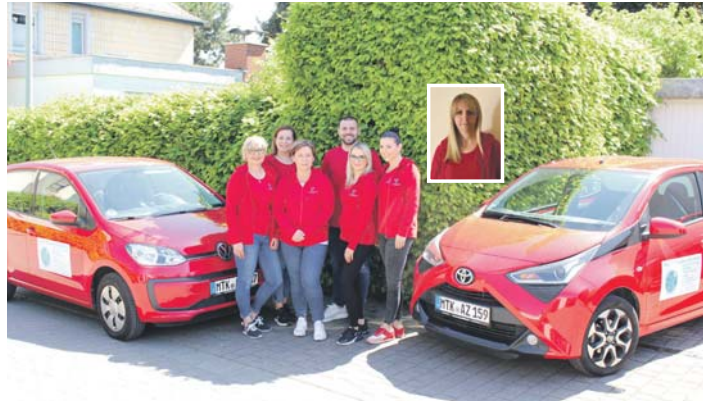
In 16 Jahren das „Mobile Pflege team Schwalbach“ hunderte Seniorinnen und Senioren aus Schwalbach und Umgebung gepflegt und sich dabei einen guten Ruf erarbeitet.