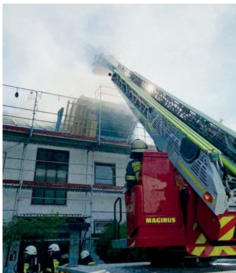
Dachstuhl in Brand. Am späten Donnerstagnachmittag vergangener Woche kam es an einem Wohngebäude in Sulzbach zu einem Dachstuhlbrand. Durch Löscheinsatz von innen und außen, sowie das Öffnen des Daches konnte der Brand gelöscht werden. Unterstützt wurde die Sulzbacher Feuerwehr hierbei von der Drehleiter der Feuerwehr Schwalbach. Die Polizei ermittelt zurzeit wegen der Brandursache.