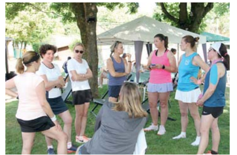
Die Damen 40 nach den Einzel bei der Besprechung, wer die Doppel spielen soll. Gegen Bad Homburg gab es ein 1:8.