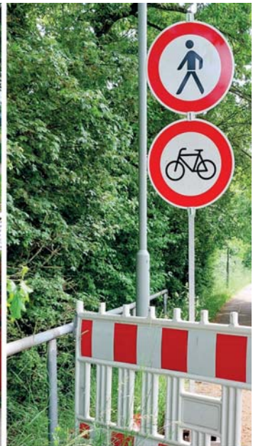
Die Fußgänger- und Radfahrerbrücke zum MTZ ist zurzeit gesperrt. Der Umweg ist weit.