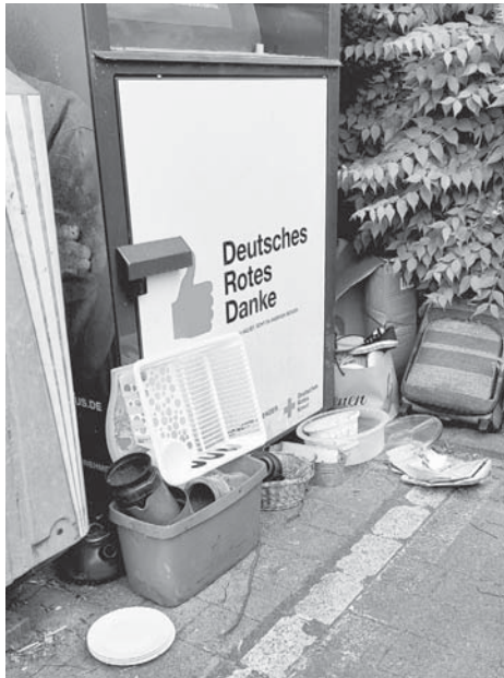
Der Sperrmüll am Platz an der Linde bot am Konfirmationssonntag kein schönes Bild.