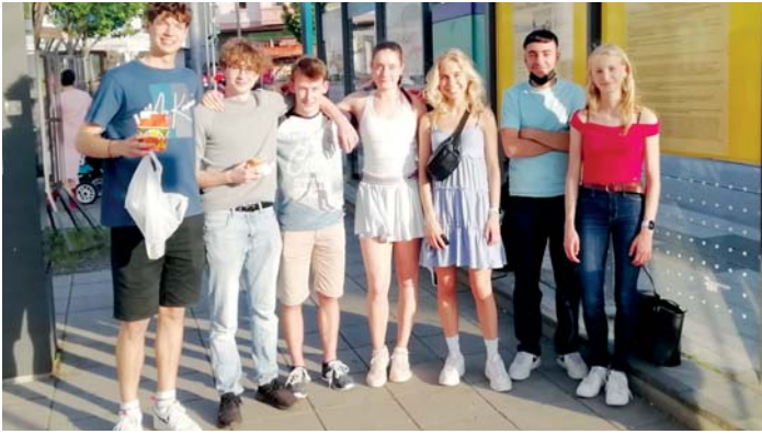
Viel Spaß hatten Oberstufenschülerinnen und -schüler im „Megalomania“-Theater.