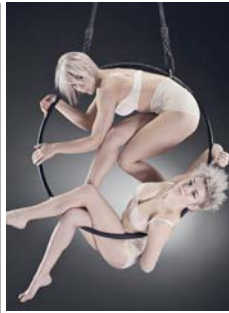
Das „Duo Sienna“ verbindet im Luftring anmutig Eleganz und Stärke.

Vom 9. Juni bis zum 3. Juli übernimmt ein internationales Artistenensemble die Kontrolle über das Neue Theater Höchst. Preisgekrönte Künstlerinnen und Künstler sowie eine Weltmeisterin in ihrer Disziplin zeigen beim Variété-Frühling tänzerische Artistik, Jonglage und Zauberei auf Weltniveau.