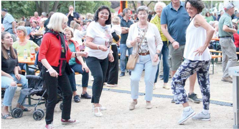
Im Laufe des Abends kamen immer mehr Tänzerinnen und auch einige Tänzer vor die Bühne am Pavillon im Kleber-Park.