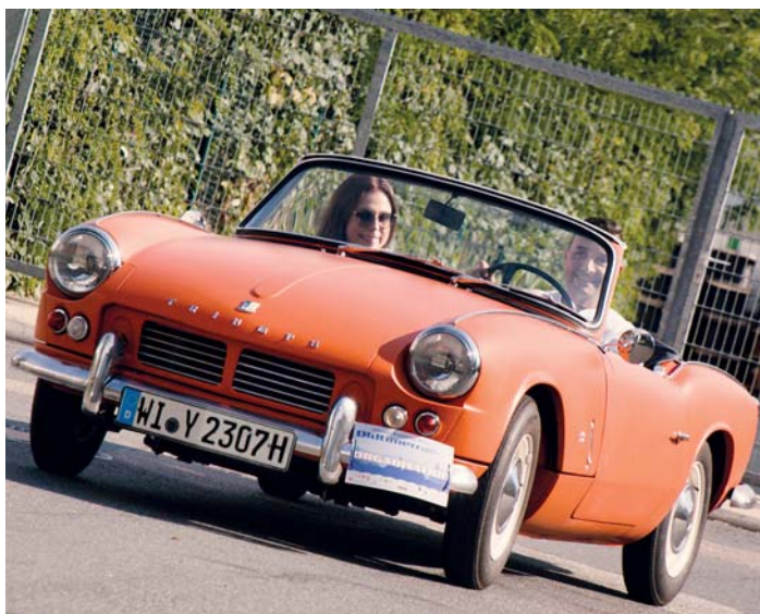
Auch in diesem sind bei der Oldtimerrallye „Main-Taunus-Klassik“ am 18. September zu zahlreiche „Oldies“ zu besichtigen.