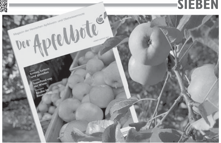
So sieht die Titelseite des neuen „Apfelboten“ aus, der gerade erschienen ist.