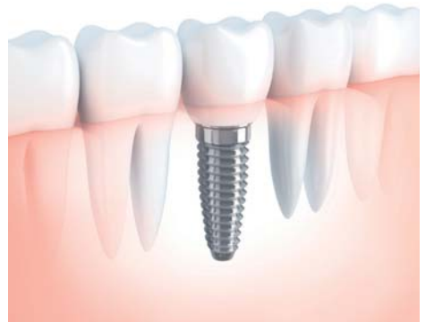
Fest im Kiefer verankerte Zahnimplantate sind eine Alternative zu konventionellem Zahnersatz.