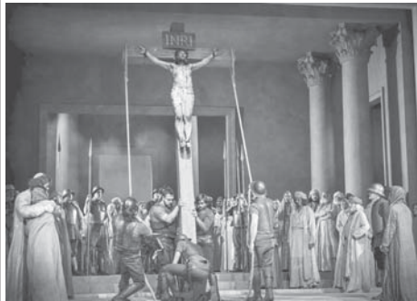
Die Aufstellung des Kreuzes ist auch in diesem Jahr eine der ergreifendsten Szenen des Oberammergauer Passionsspiels.