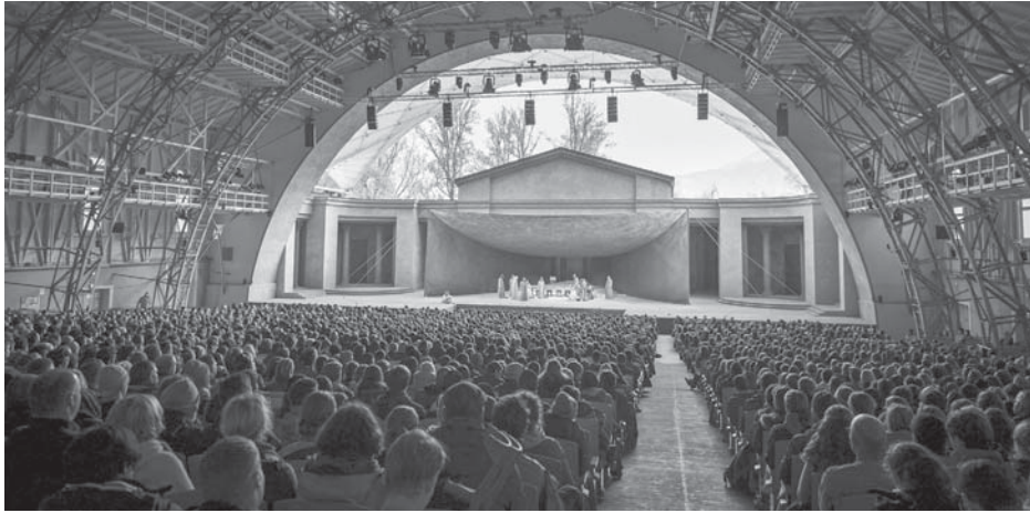
Das beeindruckende Passionstheater in Oberammergau, in dem bis zu 5.000 Zuschauer Platz finden können.

Am 20. Oktober 2018 waren die aktuellen Rollenbesetzungen bekannt gegeben worden. Eineinhalb Jahre später - nach dem Corona-Ausbruch - hatten die Beteiligten wochenlang vergeblich gehofft und gebangt. Und vielleicht sogar gebetet. Umsonst. Es gab vor zwei Jahren keine Chance bis zu 5.000 ungeimpfte Menschen ins zwar luftige, aber