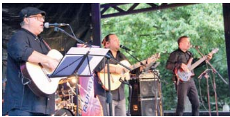
Mit Gesang und Gitarren begeisterte die Band das Publikum.

Hochzufrieden zeigten sich Monika Moser und Sandra Schiwy, die im Rathaus für die Kulturarbeit in der Gemeinde verantwortlich. gs