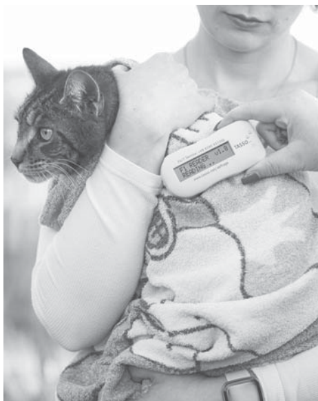
Mit einem Transponderlesegerät können die implantierten Chips ausgelesen werden, so dass es bei Katzen und Hunden leicht gelingt, den Besitzer ausfindig zu machen.

Schüler, Studenten, Rentner und alle anderen aufgepasst! Wir suchen Austräger für den