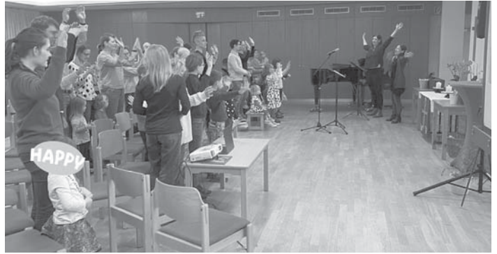
„Groß und Klein“ waren beim Familiengottesdienst der Evangelischen Kirchengemeinde am vergangenen Sonntag im Saal des Gemeindezentrums mit großem Eifer dabei.