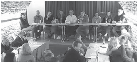
Die Jahreshauptversammlung des Sulzbacher Tennisvereins fand im Gewölbekeller des Frankfurter Hofes statt.

der Band „Sol Vivo“, die die Besucher von Beginn an zum Mitsingen ermunterten. Nach dem gemeinsamen „Vater Unser“ mit Bewegungen, halfen alle mit, eine lange Tafel mit Tischen zu stellen, um daran dann gemeinsam Pizza zu essen und sich in geselliger Runde auszutauschen. Der nächste Gottesdienst „Groß und Klein“ findet am 30. April um 11 Uhr statt. red