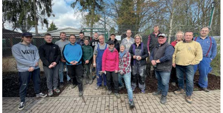
Zahlreiche Helferinnen und Helfer kamen am vergangenen Samstag, um dem Tierschutzverein Bad Soden/Sulzbach beim Abriss des alten Hundehauses unter die Arme zu greifen.

Wie Kreisbeigeordneter Axel Fink mitteilt, sollen mit dem Erlös der mittlerweile 73. Jugendsammelwoche viele Projekte unterstützt werden: „Jeder und jede kann damit einen Beitrag dazu leisten, die Arbeit für die Jugendlichen im Main-Taunus-Kreis zu unterstützen“, meint der Jugenddezernent. Bei der Jugendsammelwoche sind zum Beispiel Kinder und Jugendliche aus der Jugendfeuerwehr und aus Pfadfinder- und Sportgruppen unterwegs. Die Jugendsammelwoche wird initiiert vom Hessischen Jugendring. Sie ist fester Bestandteil der Finanzierung von Jugendarbeit. Die gesammelten Gelder werden unter den verschiedenen Kooperationspartnern aufgeteilt: Die Hälfte erhalten die sammelnden Vereine, 20 Prozent gehen an das zuständige Jugendamt für die Kreisjugendarbeit. Die übrigen 30 Prozent fließen in die Arbeit des Hessischen Jugendrings, der überregionale Projekte der Kinder- und Jugendarbeit in Hessen fördert. Nähere Informationen zu der Sammelwoche gibt es unter jugendsammelwochen.hessen.de/ im Internet. red