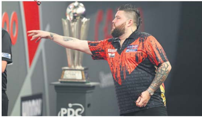
Weltmeister Michael „Bully Boy“ Smith kommt am Ostersonntag zu den „Gude Darts Open“ nach Frankfurt in die Ballsporthalle zu den „Gude Darts Open“.

„Also gleich los malen oder zeichnen, was Wasserfarben oder Stifte hergeben“, raten Arboretum-Freunde. Die Werke sollten am besten im DIN-A4-Format sein. Bis zum 28. April können die fertigen Arboretum- und Sossenheimer Weg 60, 65824 Schwalbach, geschickt werden. red