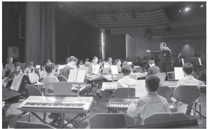
Das Abschlusskonzert zum Tastentag der Musikschule Taunus fand im März im großen Saal des Schwalbacher Bürgerhauses statt.

le berichtet. Auch kleinere Ensembles übten vorab, und manches konnte tatsächlich erst am Samstagmittag vor Ort im Bürgerhaus fertig vorbereitet werden. So blieb ein kleiner Nervenzettel für alle Beteiligten bis zum Schluss.