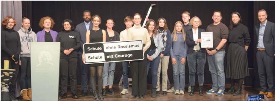
Die AES hat Ende März in einer Feierstunde offiziell den Titel „Schule ohne Rassismus, Schule mit Courage“ erhalten.