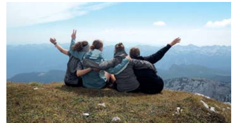
In die Berge Sloweniens führt eine Jugendfreizeit des Evangelischen Dekanats Kronberg in den Sommerferien.

Für Naturliebhaber gilt Slowenien längst schon als Geheimtipp: Das Land bietet Gebirge im Norden und im Süden eine fast 50 Kilometer lange Adria-Küste. Über die Hälfte des Landes ist mit Wald bedeckt, zudem gibt es zahlreiche Seen, Schluchten, Flüsse und Wasserfälle. Die Hiking-Tour der Dekanatsjugend beginnt am Bohinj See im Herzen des Nationalparks Triglav, eingrahmt von den Gipfeln der Julischen Alpen. Die Jugendlichen wandern von dort aus mit ihrem Gepäck fünf Tage in die Berge,