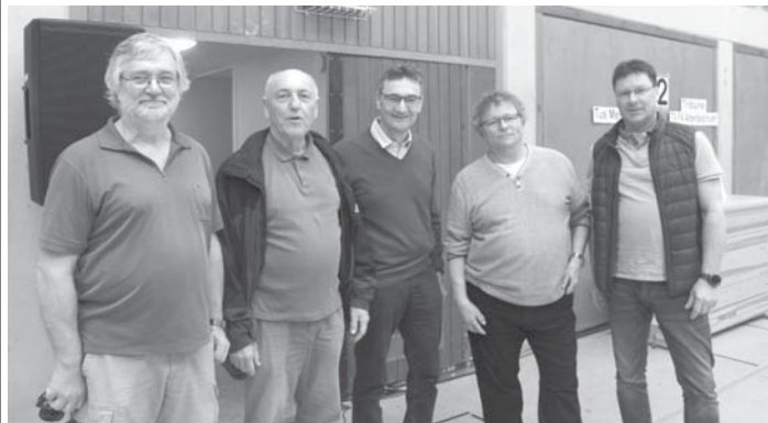
Die TSG-Jedermann waren zu Gast bei der deutschen Prellballmeisterschaft.