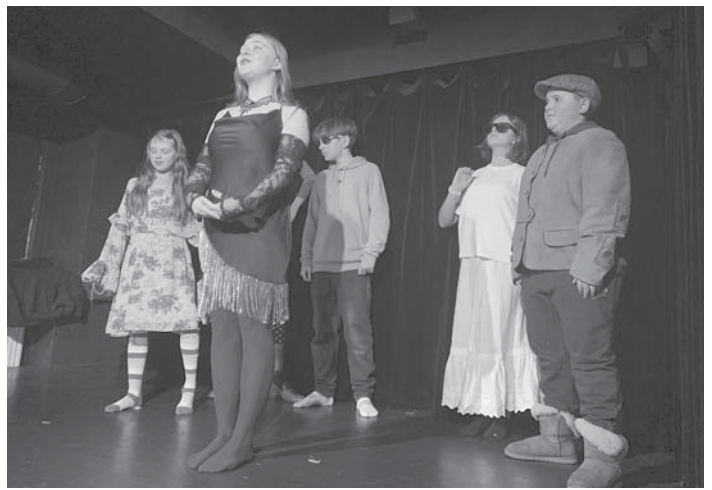
Schülerinnen und Schüler der Intensivklasse standen auf der Bühne des Galli-Theaters. gs/Foto:privat