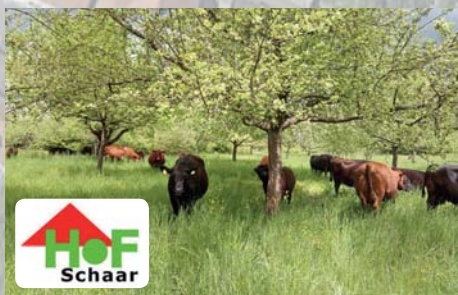
Frisch von der Weide. Im Hofladen des Hofes Schaar gibt es frisches Weideochsen-Fleisch. Bratwürste aus den besonderen Rindern verkauft der Hof Schaar beim Gewerbefest. Mehr dazu unter www.hof-schaar.de im Internet. Hof Schaar, Mainzer Str. 2, Tel. 06196/767670