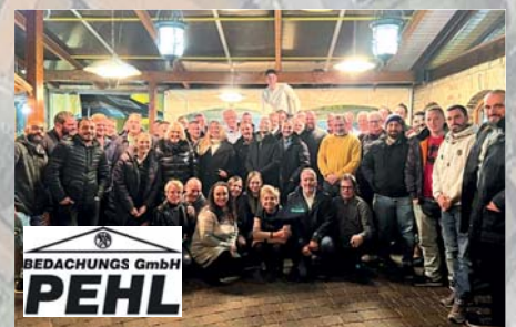
Spezialisten für Dächer. Die Firma Pehl ist Experte für alle Dachdecker- und Zimmerarbeiten. Beim Gewerbefest ist sie mit einem großen Kranwagen vor Ort und einem Modell vertreten. Sebastian Pehl Bedachungs GmbH, Bahnstraße 43, Tel. 06196/9997469.