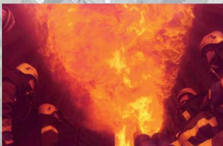
Lust auf eine neue Herausforderung? Interessierte Sulzbacher Bürgerinnen und Bürger sind bei unseren Übungsabenden - donnerstags ab 19:30 Uhr im Feuerwehrgerätehaus - jederzeit herzlich willkommen. Weitere Infos und Kontakt unter: info@Feuerwehr-Sulzbach.org