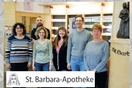
Im Dienste der Gesundheit. Die St. Barbara Apotheke ist seit über 60 Jahren in allen Gesundheitsfragen für Sie da. Zum Gewerbefest können Sie bei uns an einer Rabenhorst- & Magnesium-Verkostung teilnehmen. Für die Kleinen (und Großen) wird es einen Seifenblasen-Spaß geben.

Wiesenstraße 18 65843 Sulzbach am Taunus Telefon: 0 61 96 / 95 87 - 0 Fax: 0 61 96 / 95 87 - 140 E-Mail: info@getraenke-kreiner.de www.getraenke-kreiner.de