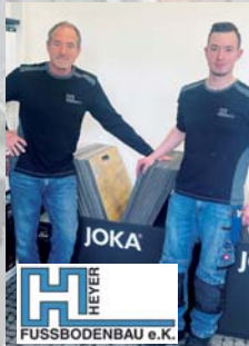
Kompetenz am Boden. Seit über 35 Jahren liegt Ihnen die Firma Heyer Fußbodenbau e.K. zu Füßen. Am gemeinsamen Stand mit Malermeister Thums zeigen wir Ihnen, wie schönes Wohnen richtig geht.