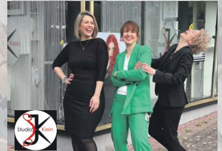
Ihr Friseur in Sulzbach. Wir bieten Ihnen die gängigen und angesagten Friseurdienstleistungen in einem modernen Salon mit ausgewählten, erstklassigen Pflege- und Styling-Produkten. Wir schneiden und stylen Ihnen Ihre perfekte Wunschfrisur. Besuchen Sie uns auf dem Gewerbefest und lernen Sie uns persönlich kennen.