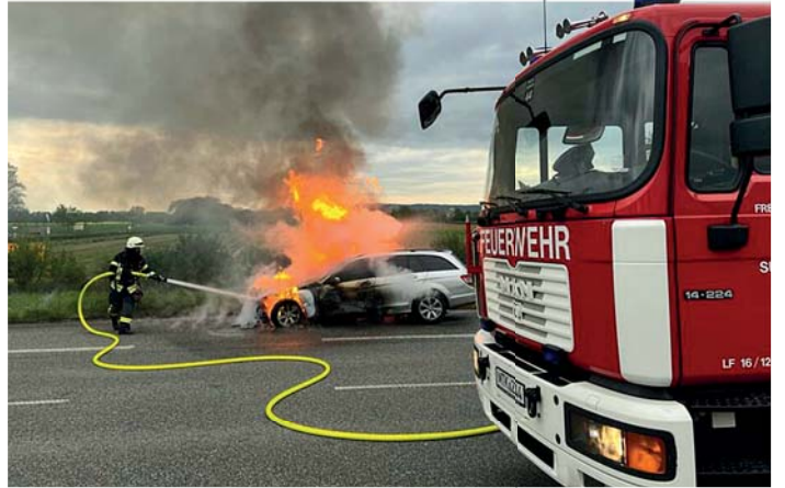
Pkw brennt aus. Vermutlich ein technischer Defekt führte am Samstag gegen 19 Uhr zum Brand eines Pkw auf der alten B8. Die Insassen des grauen Mercedes C-Klasse hatten bemerkt, dass es während der Fahrt unter der Motorhaube zu Qualmen anging. Kurz darauf fing der Pkw Feuer. Im Zuge der Löscharbeiten musste die L3266 in Richtung der A66 für eine Stunde gesperrt werden. Schnell konnte das Feuer durch einen Trupp unter Atemschutz und mit Schaum gelöscht werden. Das Fahrzeug brannte aus und musste abgeschleppt werden. Die Insassen kamen mit einem Schrecken davon.

Sie möchten eine private Kleinanzeige aufgeben? Rufen Sie uns an unter Tel. 06196 / 848080 oder senden Sie eine E-Mail an anzeigen@sulzbacher-anzeiger.de