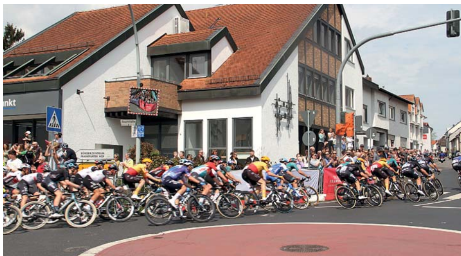
Die Rad-Elite rast zweimal durch Sulzbach und passierte in hohem Tempo und vor vielen Zuschauern die Kurve am Großen Dalles.