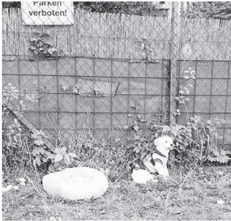
Dieser kleine, weiße Rüde wurde in der Nähe des Tierheims am Arboretum ausgesetzt.