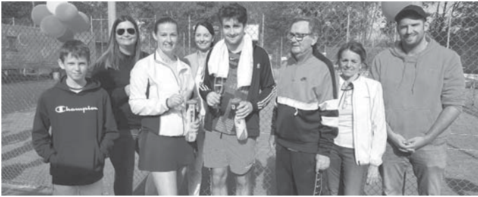
Die Gewinnerinnen und Gewinner des Schleifchen-Turniers mit der Turnierleitung und den Sportwarten. Mit dem Wettbewerb eröffnete der TVST am Samstag die Freiluftsaison.