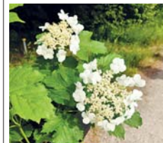
Auch der Gemeinde Schneeball kommt im Arboretum vor und kann als Heilmittel verwendet werden.

Von 10 bis 12 Uhr bietet das Forstamt Königstein eine Pilzwanderung im Arboretum mit anschließender Fundbesprechung an. Pilze sind faszinierende Organismen, die unentbehrlich für den Kreislauf des Lebens sind. Sie zersetzen totes Material, räumen so den Wald auf oder unterstützen die lebenden Pflanzen als Symbionten zum gegenseitigen Nutzen. In einem zweistündigen Spaziergang möchte Heike Schürmann gemeinsam mit den Teilnehmenden erkunden, welche Arten es im Arboretum zu entdecken gibt. Eine vorherige Anmeldung über die Pilzfreunde Südhessen Sulzbach unter pilzfreunde-sulzbach.jimdoofree.com/kontakt/ ist erforderlich. Die Teilnahme an der Führung ist kostenlos. Treffpunkt ist ebenfalls am Waldhaus. red