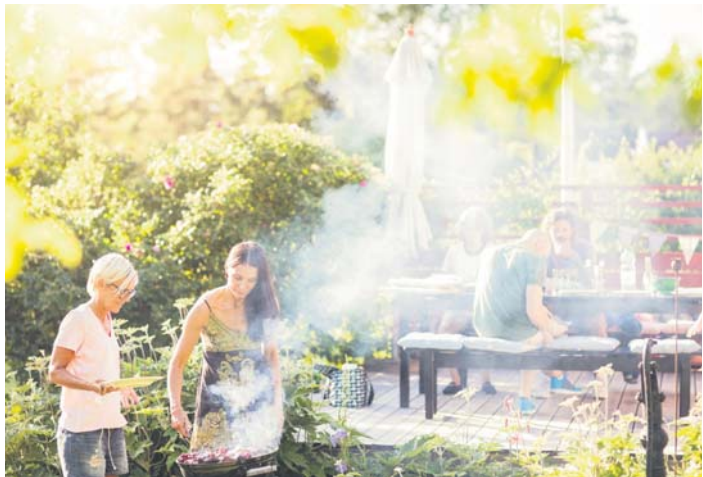
Die Deutschen lieben das Grillen. Doch der Rauch führt immer wieder zu rechtlichen Problemen, vor allem, wenn sich Nachbarn durch die Gerüche belästigt fühlen.