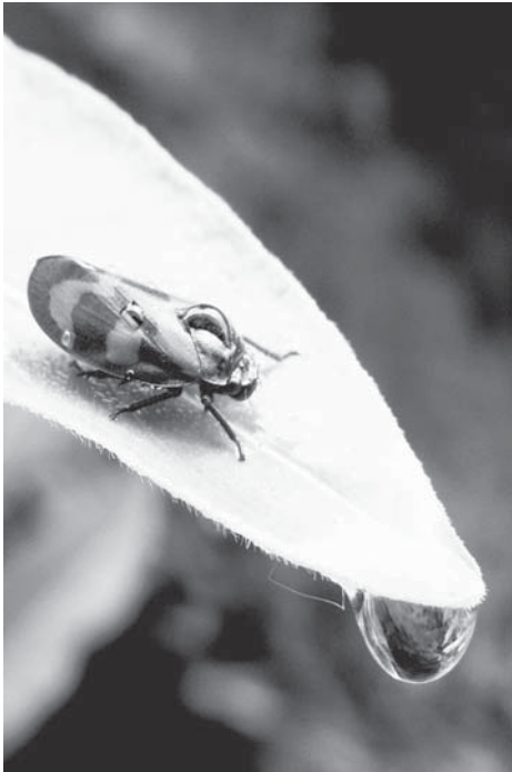
Den Insekten auf der Spur können Familien bei einer Themenführung im Arboretum am 3. Juni sein.