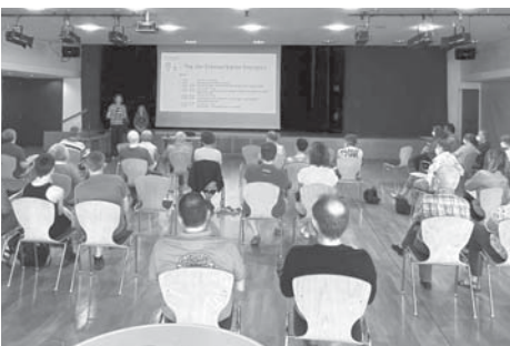
Der Verein „Klimabewusstes Bad Soden“ veranstaltet am Samstag, 20. Mai, zum zweiten Mal einen „Tag der erneuerbaren Energien“ im Bürgerhaus in Neuenhain.

Los geht es um 13.30 Uhr. Der diesjährige Tag der Erneuerbaren Energien endet gegen 18 Uhr. Der Eintritt ist frei, eine Anmeldung ist nicht erforderlich. Über eine Spende an der Kuchentheke freuen sich die Veranstalter. Details zum Programm und dem Verein gibt es unter klimabewusstes-bad-soden.de im Internet. red