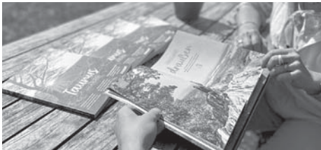
Das Taurus-Magazin, das jetzt erstmals erschienen ist, nimmt Leserinnen und Leser mit auf eine Reise quer durch den Taurus und inspiriert zu Abenteuer, Auszeiten und Genuss im Taurus.

Damit bietet der TTS den Magazin-Lesern zahlreiche Anregungen für ihren nächsten Besuch. Ganz gleich ob Entspannung beim „Waldbaden“, auf der Suche nach dem besten Skyline-Blick mit den Bloggerinnen von Bevandert oder beim Abendessen unter hunderten von Apfelbäumen - in den Berichten, die mit vielen Bildern hinterlegt sind, wird die regionale Identität der Freizeitregion deutlich. So präsentiert das neue Magazin nicht nur die historische Vielfalt des Taurus, sondern gibt auch Einblicke in die hessische Küche oder die regionale Mundart.