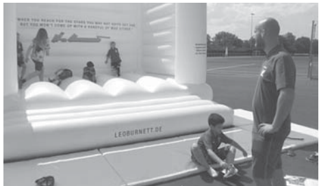
Der Samstag stand am Festwochenende im Zeichen der Familien. Unter anderem hatte der 1. FC eine Hüpfburg aufgebaut.

Ansonsten wurde drei Tag lang unter dem Motto „Gemeinsam. Ein Verein“ gefeiert. Am Samstag gab es unter anderem ein „Street Soccer Turnier“ für alle Kinder, ein Kleinfeld-Turnier der zweiten Herrenmannschaft, ein C-Jugend-Meisterschaftsspiel sowie einen Kinder- und Familientag mit zahlreichen Aktivitäten für Groß und Klein. Abends heizte dann die Sulzbacher „Maine Bänd“ den Besucherinnen und Besuchern im Festzelt ein. mfb