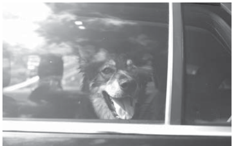
Jedes Jahr sterben Hunde qualvoll in heißen Autos.

Die Initiative bietet neben Workshops für die Klassen eine Ausprobierphase im Schullalltag und einen Vorfahrttag am Ende des Projekts. „Weil die Lehrkräfte eng in das Projekt eingebunden sind, können sie künftig eigenständig mit dem Calliope mini arbeiten und eigene Ideen umsetzen“, erläutert Axel Fink. red