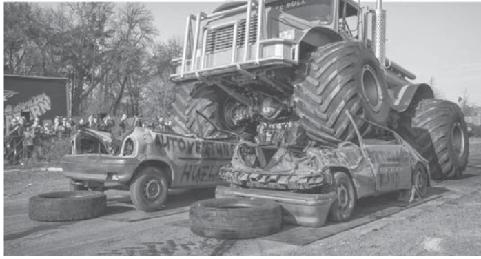
Die Monstertrucks zermahlen alles, was ihnen unter die dicken Räder kommt.

Die Mitteilungen aus den Vereinen sind ein freiwilliger Service des Sulzbacher Anzeigers. Für Inhalt und Orthografie sind allein die Vereine bzw. die Unterzeichner verantwortlich. Der Verlag behält sich Kürzungen vor. Ein Anspruch auf Abdruck in der Rubrik besteht nicht.