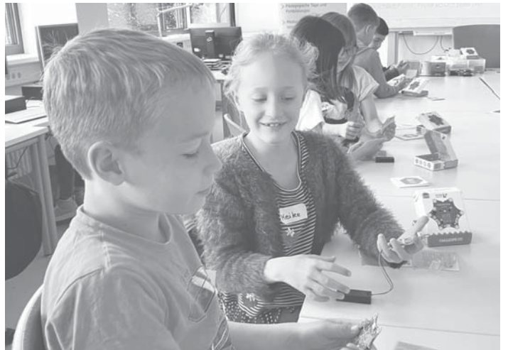
Erste Erfahrungen im Programmieren können Schülerinnen und Schüler im Main-Taunus-Kreis jetzt schon an der Grundschule machen, auch in der Schwalbacher Kinderzeit-Schule.

Von 9.30 Uhr bis 11.30 Uhr gibt es in der Königsteiner Straße 6a ein gemeinsames Frühstück zu einem gemütlichen Start in den Tag. Getränke und Brötchen stehen bereit. Alle Teilnehmenden können gerne etwas zum Belegen beisteuern. Natürlich gibt es auch wieder eine Spielecke für die Kleinen und viel Zeit für Gespräche. Neue Gesichter sind willkommen. Die Teilnahme ist kostenfrei. Es wird um Anmeldung gebeten bis zum 22. Juni unter evangelische-familienbildung.de im Internet. red