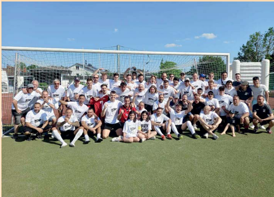
Aufstieg zum Jubiläum. Besser hätte das Timing nicht sein können. Pünktlich zum Festwochenende anlässlich des 75-jährigen Bestehens des 1. FC Sulzbach schaffte die erste Mannschaft am vergangenen Sonntag auf heimischem Platz den Aufstieg in die Kreis-Oberliga. Mit 2:0 wurde im zweiten Relegationsspiel der SV Hofheim besiegt. Nachdem der 1. FC bereits am Donnerstag vergangener Woche das Hinspiel mit 5:3 gewonnen hatte, ist damit der Aufstieg perfekt. Mehr zur Feier des Aufstiegs und des Vereinsjubiläums lesen Sie auf Seite 3.