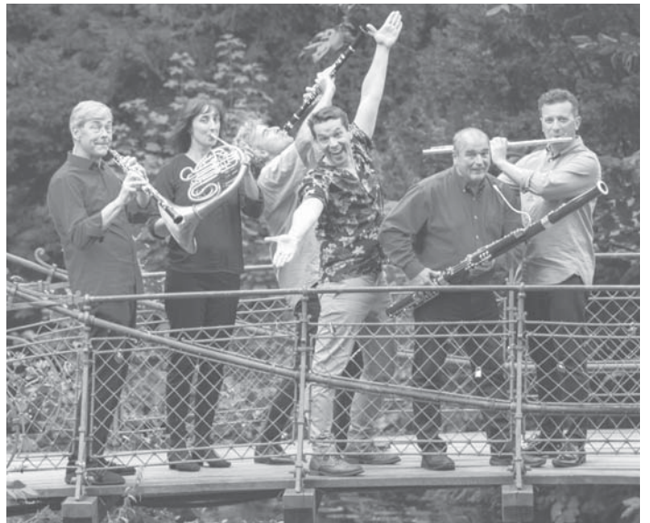
Die Süddeutschen Bläsersolisten „Pro Five“ spielen am Donnerstag, 29. Juni, den „Karneval der Tiere“ für Kinder und Familien im Landratsamt in Hofheim.

Karten kosten zehn Euro, für Kita- und Schulgruppen fünf Euro bei freier Platzwahl. Die Tageskasse ist für die Nachmittagsvorstellung eine Stunde vor Beginn geöffnet. Ansonsten gibt es Karten nur im Vorverkauf beim Main-Taunus-Kreis per E-Mail an kultur@mtk.org oder unter der Telefonnummer 06192/201-2536 und bei Frankfurt-Ticket unter frankfurt-ticket.de im Internet. red