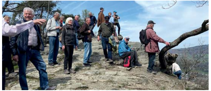
Auch bei der öffentlichen Wanderung mit dem Landrat ging es dieses Jahr an einen „Ort der Freiheit“ - zum Staufeu. Dort leisteten die Brüder von Gagern den „Staufeu-Schwur“.