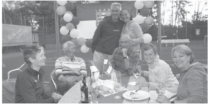
Frohlich feierten die TVST-Mitglieder am vergangenen Samstag vor der Hessen-Fahne.

Wir kaufen Wohnmobile + Wohnwagen 0 39 44 - 3 61 60 www.wm-aw.de Fa.