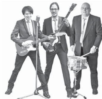
Die Band „The 2nd Generation“ nimmt die Besucherinnen und Besucher beim Fest der Vereine mit auf eine musikalische Zeitreise in die 60er- und 70er-Jahre.

Das „Fest der Vereine“, das vom Vereinsring ausgerichtet und vom Gemeindevorstand veranstaltet wird, ist die erste größere Veranstaltung des Vereinsrings in diesem Jahr. Das Kinderfest folgt am Sonntag, 10. September, von 14 bis 18.30 Uhr im Bürgerzentrum Frankfurter Hof. red