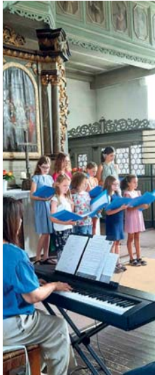
Der Kinder- und der Jugendchor begeisterten die zahlreichen Besucherinnen und Besucher in der evangelischen Kirche.