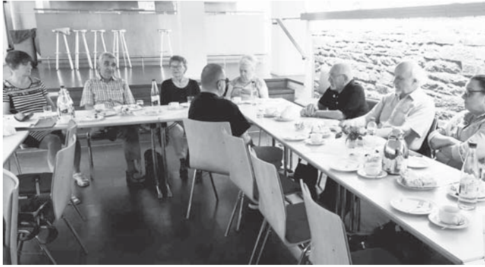
Der VdK-Sulzbach traf sich zur Jahreshauptversammlung im Gewölbekeller im Frankfurter Hof.