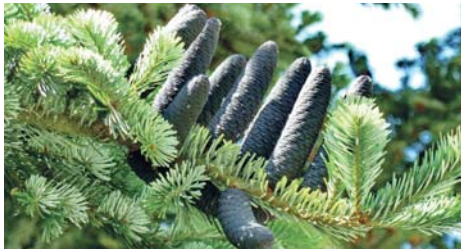
Exotische Früchte, wie die Zapfen der Korea-Tanne, können am Sonntag bei einer Führung im Arboretum entdeckt werden.

gang mit dem Waldpädagogen Johannes Schwed lernen die Teilnehmenden eine Auswahl dieser Früchte durch betrachten, fühlen, schmecken und riechen kennen. Treffpunkt ist das Waldhaus in der Straße „Am weißen Stein“. Die Teilnahme kostet fünf Euro für Erwachsene und zwei Euro für Kinder. red