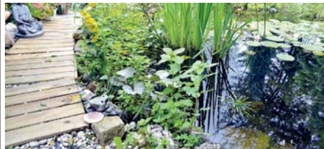
Im Herbst gibt es am Gartenteich viel zu tun.

Bei nicht ganz so kalten Temperaturen kann außerdem ein Teichbelüfter dabei helfen, den Teich eisfrei zu halten. Ob Fische im Gartenteich überwintern können, hängt auch von der Tiefe des Gewässers ab. Damit sie den Winter unbeschadet überstehen, sollte er eine Wassertiefe von mindestens 50 bis 80 Zentimetern haben. Beim Füttern stellen Teichbesitzer im Herbst am besten auf leicht verdauliches Spezialfutter für die kalte Jahreszeit um. djd