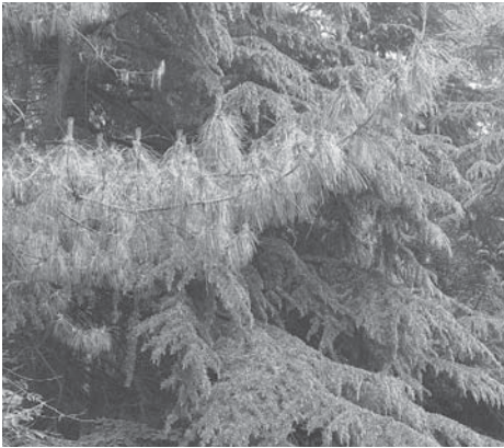
Die Tränenkiefer stammt aus dem östlichen Himalaya. Die Bäume sollen durch Pflegemaßnahmen besser sichtbar werden.