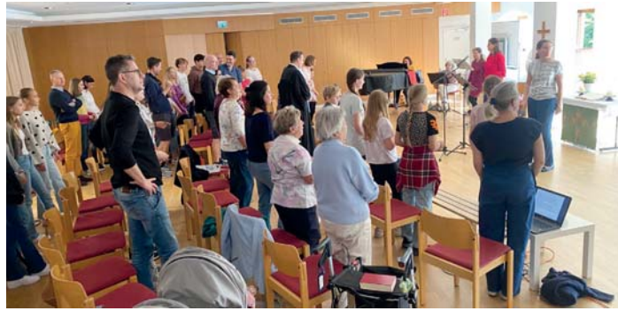
Zahlreiche große und kleine Besucherinnen und Besucher kamen beim „Groß & Klein“-Gottesdienst im evangelischen Gemeindehaus am Platz an der Linde zusammen.