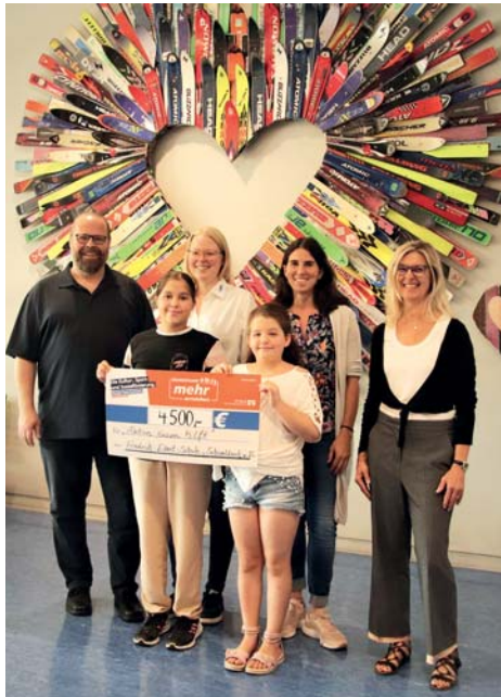
Die Friedrich-Ebert-Schule hat vor den Sommerferien einen Spendenlauf veranstaltet. Die erlaufenen Spenden in Höhe von 4.500 Euro wurden nun an die „Aktion Hessen hilft“ übergeben.

Nach den Sommerferien überreichte die Schule das Geld an die „Aktion Hessen hilft“. Diese Hilfsorganisation unterstützt unter anderem Menschen in der Ukraine, der Türkei, Syrien und im Ahtal. Seit 1991 sammelt sie Spenden von hessischen Schulen. Bisher beteiligten sich an der hessischen Schulaktion für Menschen in Not mehr als 300 Schulen. red