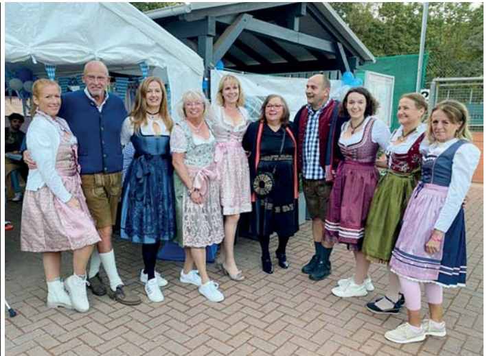
Lockere Trachtenschau vor der ersten gezapften Maß beim Sulzbacher Tennisverein.

Mit zunehmender Dunkelheit wurde es aber frisch auf der Anlage. Deshalb wurde das offene Zelt dann mit Planen gegen den Luftzug zugehängt. Mit Decken halfen sich die gut gelaunten Mitglieder, Gäste und Förderer des Vereins zusätzlich gegen die aufziehende Kälte. Für etwas Erwärmung sorgte die leckere Nachspeise, nämlich rezept-