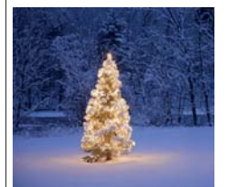
Am 13. Dezember dreht sich im Waldhaus im Arboretum alles um den Weihnachtsbaum und seine Geschichte.

anderen vorgetragen. Die Teilnahme kostet fünf Euro für Erwachsene und zwei Euro für Kinder. red