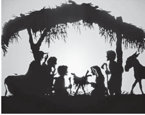
Das Krippenspiel in Form eines Schattenspiels zeigt das „Theater der Dämmerung“ mit „Das Wegg'taler Krippe“ in der Evangelischen Kirche.