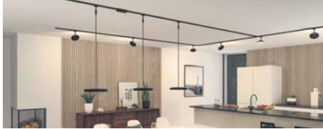
Licht nach Wunsch: Auch die vorhandene Beleuchtung, zum Beispiel in Form von Schienensystemen, lässt sich nachträglich „smartifizieren“.

So lassen sich auch vorhandene Beleuchtungen leicht steuern