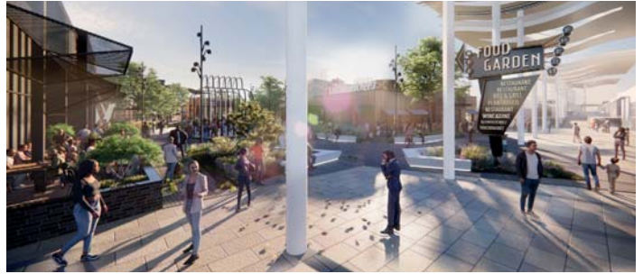
So soll ein Bereich des neuen „Food Gardens“ im Main-Taunus-Zentrum einmal aussehen. Grafik: ECE

Alle Angebote sind für die Familien kostenfrei und werden über Spenden finanziert. Wer das Projekt mit einer Spende oder als Sponsor unterstützen will, kann sich beim „Sternenzelt“-Team per E-Mail an sternenzelt@dekanat-kronberg.de melden. Mehr Informationen zum Projekt gibt es unter evangelische-familienbildung.de im Internet. red