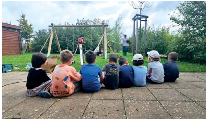
Die Kinder der DRK-Kita Zuckerrübe freuen sich, endlich im Garten schaukeln zu können.

Wir kaufen Wohnmobile + Wohnwagen 0 39 44 - 3 61 60 www.wm-aw.de Fa.