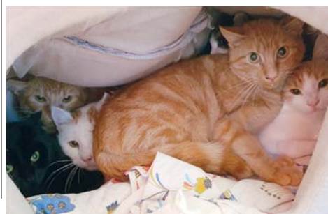
Diese Katzen, die zurzeit im Tierheim am Arboretum leben, suchen einen Platz, wo sie regelmäßig gefüttert werden und im Winter einen warmen Schlafplatz finden.

im Tierheim setzen nun in vielen Stunden alles daran, dass die Katzen ihre Menschenscheu verlieren und so vermittelbar werden. Bei den jungen Kätzchen gelingt das in der Regel sehr gut, aber einige der älteren werden wohl immer recht scheu bleiben.