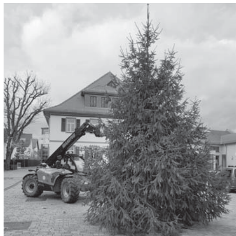
Zehn Meter hoch ist die Tanne, die der Reiterhof Kranz für den Innenhof des Bürgerzentrums Frankfurter Hof gespendet hat.