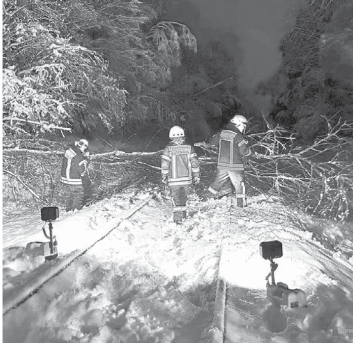
Umgestürzte Bäume. Auch in Sulzbach setzten am Montagabend die Mengen an Neuschnee den Bäumen zu, sodass die Kräfte der freiwilligen Feuerwehr mehrere Einsatzstellen mit umgestürzten Bäumen abarbeiten mussten. Auch in den Abend- und Nachtstunden sorgten die anhaltenden Schneefälle für weitere Einsätze. Weitere Bäume stürzten auf Wege und einen Pkw sowie auf die Oberleitung der S-Bahn-Linie, deren Strecke gesperrt werden musste.

Die Mitteilungen aus den Vereinen sind ein freiwilliger Service des Sulzbacher Anzeigers. Für Inhalt und Orthografie sind allein die Vereine bzw. die Unterzeichner verantwortlich. Der Verlag behält sich Kürzungen vor. Ein Anspruch auf Abdruck in der Rubrik besteht nicht.