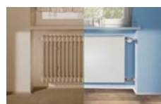
Der Energiesparheizkörper „therm-x2“ passt auf die Anschlüsse des alten Radiators.

Doch viele fürchten die aufwendigen Arbeiten, die bisher mit einem Heizkörperaustausch verbunden waren. Doch stimmen die Nebenabstände spezieller Renovierungslösungen genau mit denen der alten DIN-Radiatoren überein, lassen sich die Heizkörper leicht austauschen. Aufwendige Umbauarbeiten sind somit nach Angaben des Herstellers nicht notwendig. pr