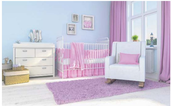
Vinyl-Designböden lassen sich mit großflächigen Klebebandern direkt auf den vorhandenen, fest geklebten Glattbelag verlegen.