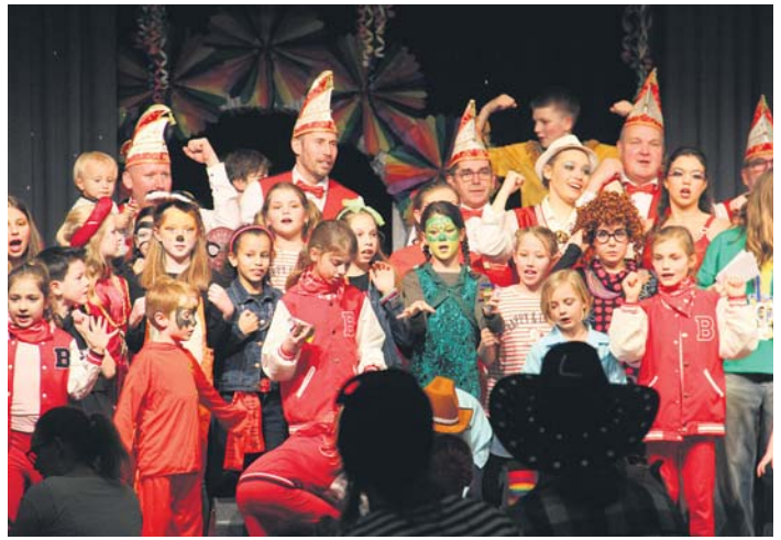
Zum Finale kamen noch einmal alle Närinnen und Narren mit dem Elferrat auf die Bühne.

Die Täter entwendeten eine niedrige dreistellige Bargeldsumme aus dem Kassensbereich. Anschließend flüchteten sie mit dem Diebesgut in unbekannte Richtung. Bei der Tat und der Flucht wurden die Täter gefilmt. Die Auswertung des Videomaterials dauert noch an. Die Kriminalpolizei in Sulzbach hat die Ermittlungen übernommen und bittet unter der Telefonnummer 06196/2073-0 um Hinweise aus der Bevölkerung.