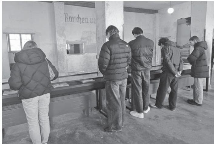
Die Jugendlichen der „Schule ohne Rassismus“-AG der Albert-Einstein-Schule waren emotional berührt vom Besuch der KZ-Gedenkstätte Dachau in der Nähe von München.

Am zweiten Tag war zugleich der Gedenktag der Opfer des Nationalsozialismus und es ging frühmorgens in die Gedenkstätte, wo die Jugendlichen bei einer Führung das ehemalige Arbeitslager Dachau erkundeten und ausführlich über die dortigen Strukturen des NS-Regimes aufgeklärt wurden. Am Nachmittag besuchte die Gruppe den SS-Schießplatz in Herbershausen und befasste sich mit den antijüdischen Rechtsvorschriften der Jahre 1933 bis 1945. Auf Wunsch der Jugendlichen beschäftigten sie sich am Vormittag des letzten Tages mit