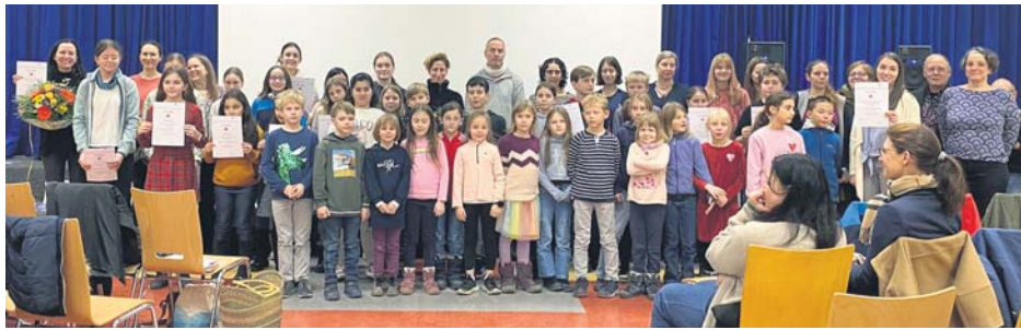
Zahlreiche Kinder und Jugendliche beteiligten sich im vergangenen Jahr an dem Jugendkunstwettbewerb „Intermezzo“. Der Main-Taunus-Kreis hat nun die ausgewählten Projekte präsentiert.