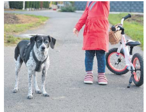
Kinder können bereits in jungen Jahren gut in die Tierbetreuung und -versorgung eingebunden werden.