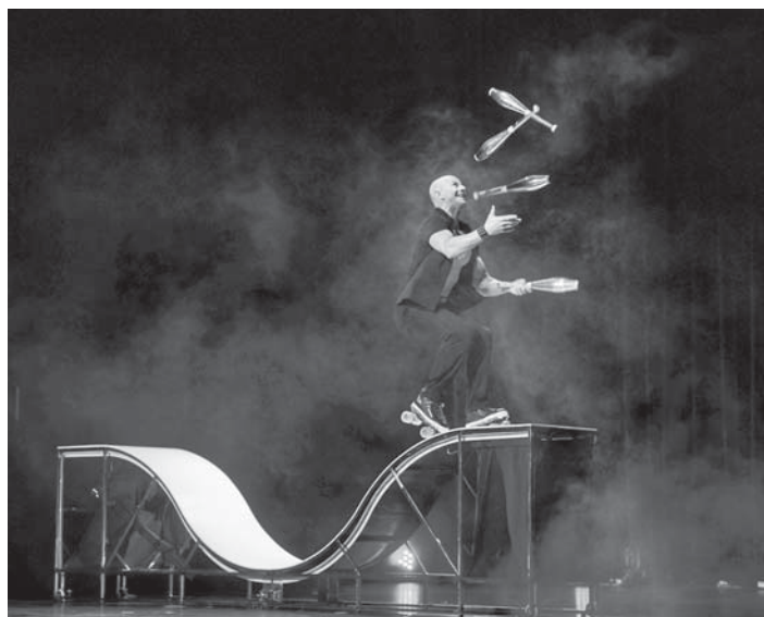
Auch „TJ-Wheels“ ist beim diesjährigen Variété Frühling im Neuen Theater Höchst und begeistert mit seinen Darbietungen, bei denen er Rollschuhfahren mit Jonglieren kombiniert.

Der Eintritt kostet 20 Euro. Karten gibt es bei der Geschäftsstelle der Kulturkreis GmbH im Schwalbacher Rathaus, den Ticket Regional-Vorverkaufsstellen sowie an der Abendkasse. red