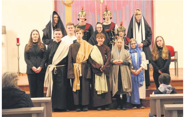
Die Sulzbacher Ministrantinnen und Ministranten zeigten in diesem Jahr ein Passionsspiel.

Unterteilt ist die Leidensgeschichte in drei Sequenzen: „Die Verhaftung Jesu und das jüdische Verhör“, „Der Prozess vor dem römischen Gericht“ und „Kreuzweg, Kreuzigung und Grablegung“. Zwischen den Abschnitten sang die Gemeinde aus dem Gesangbuch österliche Passions-Choräle, die auch textlich zur Aufführung passten. Hochkonzentriert rezitierten die jugendlichen Messdiener ihre Passagen aus der Textvorlage.