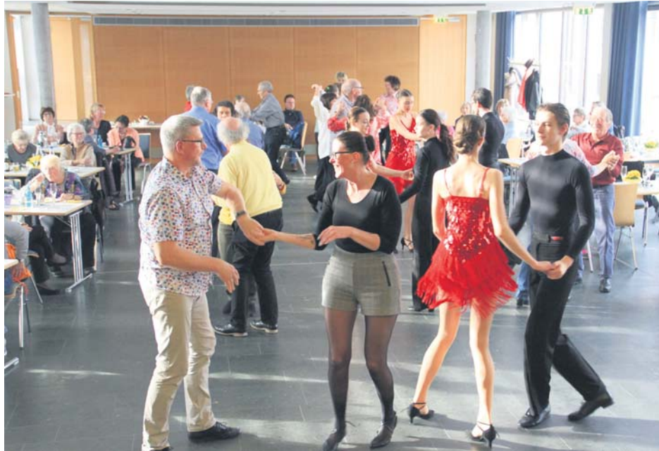
Die beschwingende Live-Musik und die Tanzgruppe der Tanzschule Pelzer lockten zahlreiche Frühlingst-Besucherinnen und -Besucher am vergangenen Sonntag auf die Tanzfläche im Schulheißensaal im Bürgerzentrum Frankfurter Hof.

Jetzt kostenlos die E-Paper-Ausgabe bestellen! info@sulzbacher-anzeiger.de