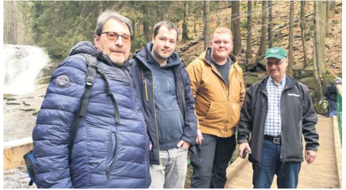
Eine Wanderung im Riesengebirge darf beim Besuch der tschechischen Partnerstadt nicht fehlen.

Sie möchten eine private Kleinanzeige aufgeben? Rufen Sie uns an unter Tel. 06196 / 848080 oder senden Sie eine E-Mail an anzeigen@sulzbach-anzeiger.de