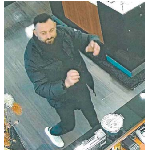
Nach diesem Mann fahndet derzeit die Polizei. Er soll im November vergangenen Jahres mehrere hochwertige Uhren bei einem Juwelier im MTZ gestohlen haben.