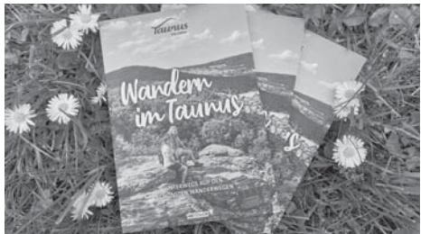
Die neue Wanderbroschüre des Taunus Touristik Service (TTS) ist ab sofort erhältlich.

Das neue Wandermagazin im DIN-A5-Format kann ab sofort kostenfrei in der größten Tourist-Info des Taunus, im Taunus-Informationszentrum an der Hohemark in Oberursel, bestellt werden und ist darüber hinaus auch in den Tourist-Informationen und Bürgerbüros der Mitgliedsorte des TTS erhältlich. Eine PDF-Datei der Broschüre soll in den nächsten Tagen auf der Webseite taunus.info zum Download verfügbar sein. red