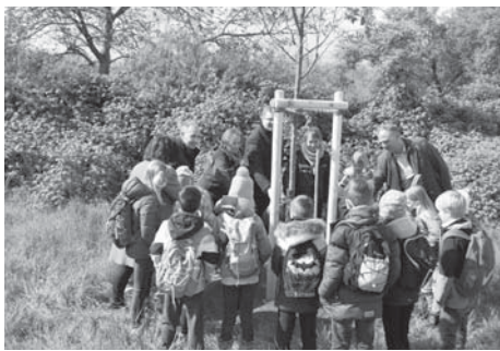
Schülerinnen und Schüler der Schwalbacher Geschwister-Scholl-Grundschule gossen gemeinsam mit Vertreterinnen des Forstamts und mehreren MTK-Bürgermeistern eine frischgepflanzte Mehlebeere an.

Eine Gemeinschaftsveranstaltung der Gemeinde Sulzbach (Taunus) und des Geschichtsvereins Reichsdorf Sulzbach 1979 e. V. Die Veranstaltung wird am Dienstag, 28. Mai 2024, als „Dämmerschoppen“ um 20:00 Uhr wiederholt. Als Veranstaltungsort dient ebenfalls der Gewölbekeller im Bürgerzentrum „Frankfurter Hof“.