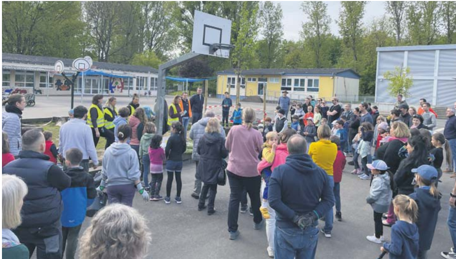
Zahlreiche Schülerinnen und Schüler kamen am Samstag mit ihren Eltern auf den Schulhof der Cretzschmarschule, um bei der Gemeinschaftsaktion „Ab ins Beet“ zu helfen, die den Schulhof klimafreundlicher machen soll.

Barankauf Pkw und Busse in jedem Zustand. Sichere Abwicklung. Tel. 069/20793977 o. 0157/72170724