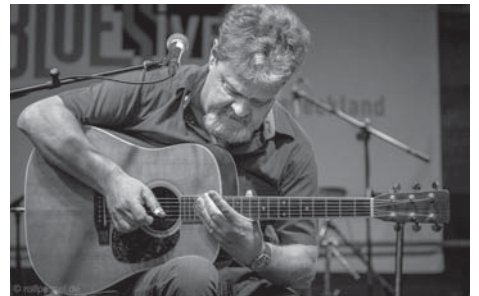
Ignaz Netzer gehört zu den führenden deutschen Blues-Musikern. An Christi Himmelfahrt spielt er in Schwalbach.

Interessierte werden gebeten, sich bis zum Freitag, 3. Mai, per E-Mail an pst.eschborn.ppw@polizei.hessen.de mit dem Betreff „Fahrradcodierung 04.05.“ und der Angabe ihres Namens und der Anzahl der zu codierenden Fahrzeuge anzumelden. Daraufhin erhalten sie Formulare sowie einen Termin. Zur Codierung sind ein Eigentumsnachweis mit Namen und Anschrift des Eigentümers sowie ein Ausweisdokument vorzulegen. Ziel der gemeinsamen Aktion von Präventionsrat und Polizei ist es, Fahrrad- und E-Scooterdiebstählen vorzubeugen. Ein codiertes Fahrzeug ist für Diebe unattraktiv. pol