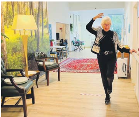
Bei der Tagespflege geht es um einen gestalteten Alltag für Seniorinnen und Senioren mit zahlreichen anregenden Bewegungs- und Gedächtnisaktivitäten.

Marita Stork: „Benötigen Sie eine intensive Pflegeberatung und/oder einen Kostenvorschlag, rufen Sie uns an. Wir vereinbaren gerne einen Termin mit Ihnen und bieten einen 'Schnuppertag' an.“ red