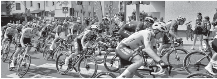
Mit hoher Geschwindigkeit sausten die Radprofis in einer Linkskurve über den Großen Dalles.

Sicht- und hörbares Zeichen, dass Spitzenreiter und Fahrer-pulk gleich durch Sulzbach flit-