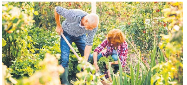
Gartenarbeit macht Freude, kann aber auch auf die Gelenke gehen.

Tagespflege Kelheim: Göltzter Straße 2 65760 Eschborn Tel. 0 61 95 / 96 19 419 info@haus-amun-re.de www.haus-amun-re.de