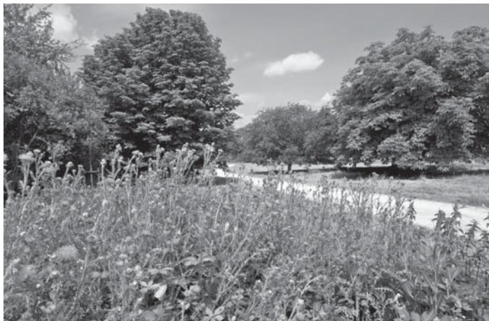
Das Forstamt lädt am kommenden Freitag zu einem besonderen Spaziergang im Arboretum ein.