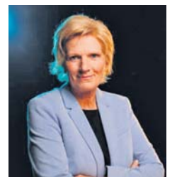
Die ZDF-Sportreporterin Claudia Neumann ist beim Sulzbacher Volkslauf zu Gast.

Neu im Boot als Spendenempfänger ist die Arbeitsgemeinschaft für Querschnittgelähmte mit Spina bifida - kurz „ARQUE“ genannt - , die Jugendliche und Erwachsene, die mit einer Querschnittlähmung zur Welt gekommen sind, auf vielfältige Art und Weise unterstützt.